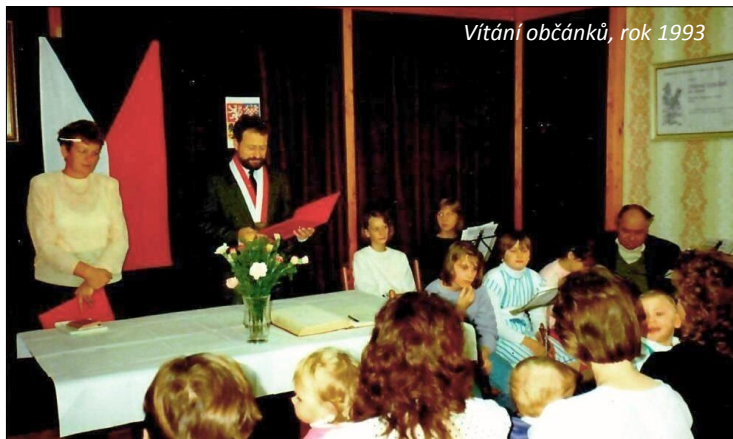
Vítání občánků, rok 1993

Ti starší ho mají, tady není zvykem několikrát za život měnit bydliště. Vztah získávají i mladí. Rekonstruují byty v domě svých rodičů, kupují parcely a staví domky. Starají se o dědictví po předcích, jako je pole, les apod. Rodiny drží při sobě, aby rodiče mohli ve stáří u mladých být.