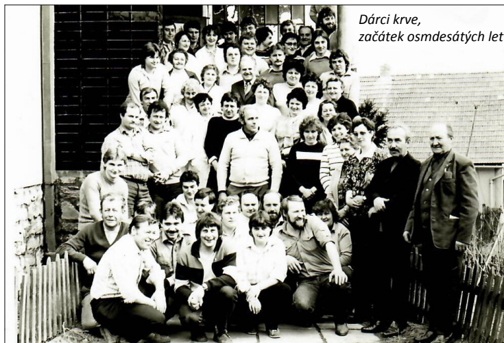
Dárci krve, začátek osmdesátých let

Do popředí však musíme dát dlouholetou soustavnou spolu-