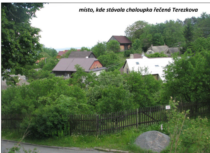
místo, kde stávala chaloupka řečená Terezkova