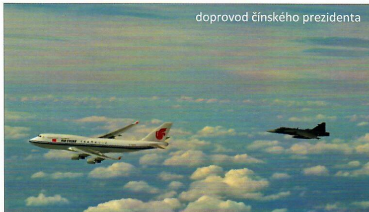
doprovod čínského prezidenta

Takže teď všichni čeští piloti ví, kde je Trpín, ale nikdo z nich na tuto krásnou krajinu dobře nevzpomíná. Vojáci, které kolem Trpína můžete vidět, hrají roli nepřátelských jednotek. Mají za úkol nás pochytat a potrestat.