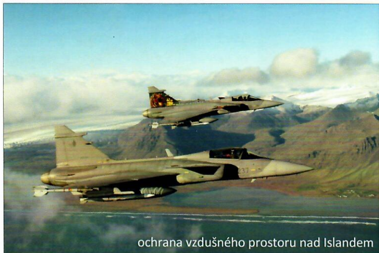
ochrana vzdušného prostoru nad Islandem

Momentálně nás žádná mise nečeká, další je plánována myslím až na rok 2019 do Pobaltských republik. Nicméně v červnu se zúčastním leteckého cvičení NATO Tiger Meet ve Francii nedaleko Brestu. Jedná se o každoroční letecké cvičení pilotů tzv. tygřích letek vzdušných sil v rámci NATO, které se setkávají od 60. let. Mají možnost lépe se seznámit, vyměnit si zkušenosti a prohloubit spolupráci při plnění společných úkolů.