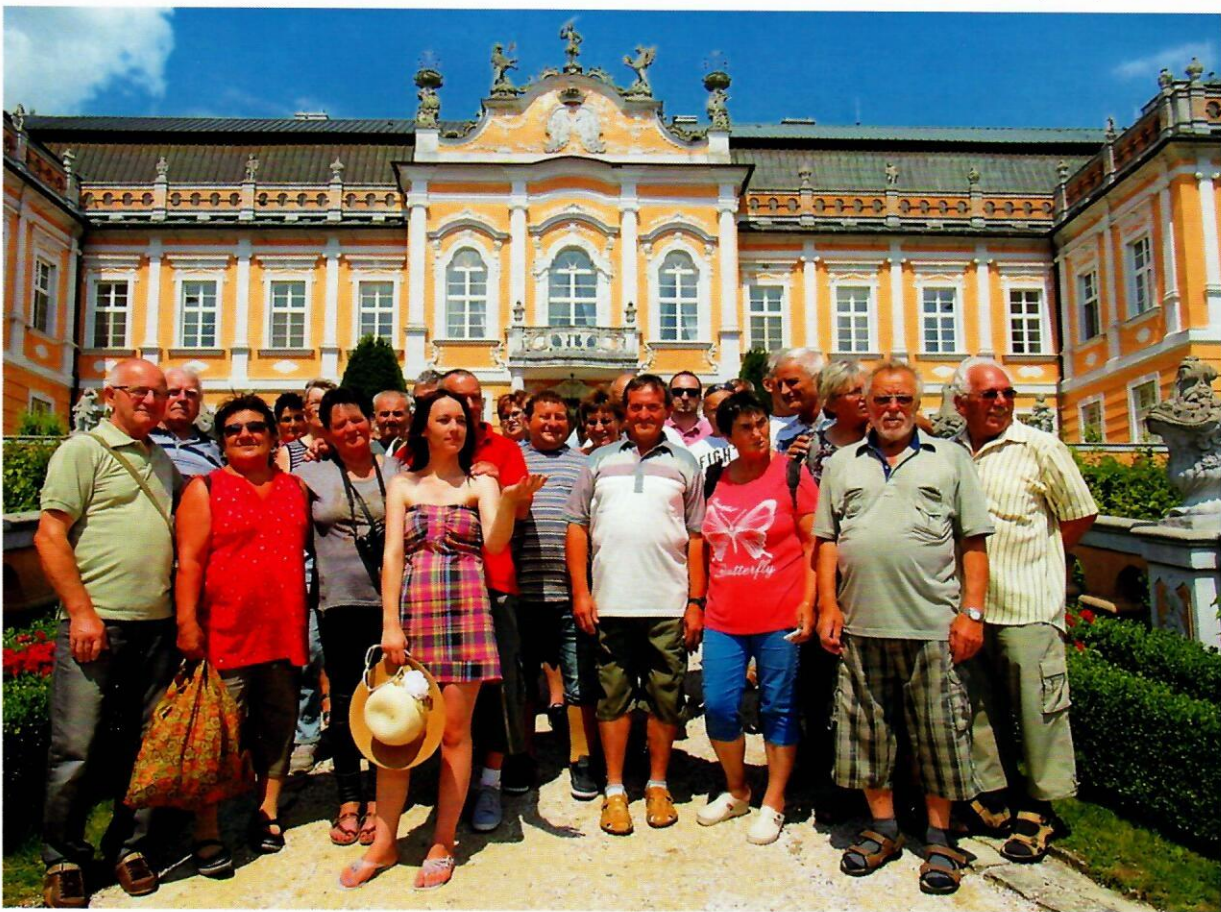
Na zámku Nové Hrady

Na závěrečném společném obědě jsme byli panem starostou pozváni na návštěvu Palkonye v příštím roce.