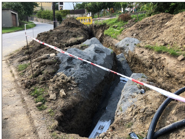
foto: Obnova vodovodního řádu v Hlásnici

V Hlásnici probíhá rovněž výměna hlavního vodovodního řádu. Práce na levém rameni jsou již u konce a probíhá napojování jednotlivých nemovitostí. Bude následovat část pravého ramene. Máme v plánu tuto fázi zvládnout ještě v tomto roce. Plánovaný souběh s opravou koryta potoka se nezdařil, protože Lesy ČR, jakožto investor opravy potoka, stále nevysoutěžily zhotovitele stavby. Chtěl bych poděkovat všem, kteří se na této realizaci podílejí, a také obyvatelům Hlásnice za trpělivost při výpadech v dodávkách vody během realizace.