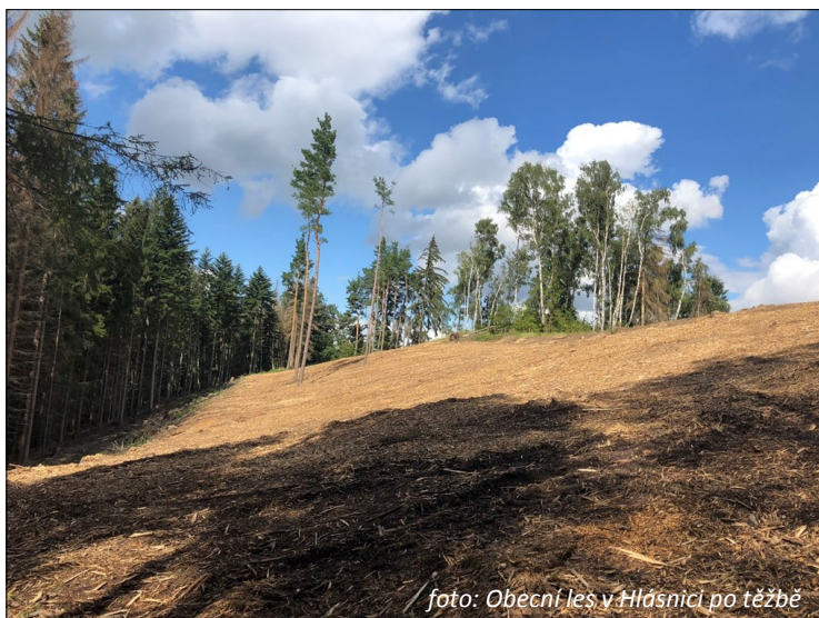
foto: Obecní les v Hlásnici po těžbě

V obecním lese v Hlásnici byla dokončena těžba kůrovcem napadeného smrkového porostu. Bylo vytěženo celkem 1 000 m 3 dřeva, které bylo následně odprodáno. Dřevo z Hlásnice bude sloužit nejenom k topení pro obyvatele Hlásnice a Trpína, ale dostane se i k dalšímu zpracování, a to mimo jiné do Číny nebo jako sloupy elektrického vedení do Gruzie. Výnos z prodeje dřeva bude primárně určen pro úklid, výstavbu oplocenek a výsadbu nového lesa. V závěru léta se bohužel začaly objevovat další suché stromy, a tak je velice pravděpodobné, že postup kůrovce bude pokračovat.