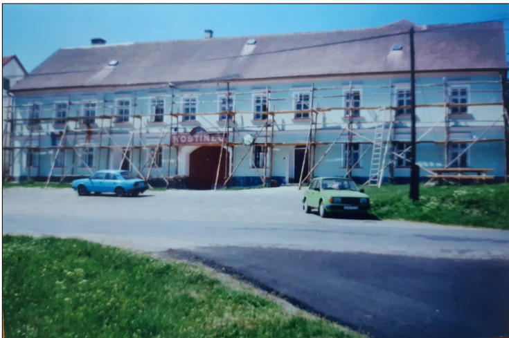
Lešení u Kozáků

Hospoda na tomto místě fungovala už asi před 150 lety. Založil ji můj předek Macků, který se živil povoznictvím. Zajížděl do Itálie, pozdější Jugoslávie i jinam se Inem a tkaninami a zpátky vozil kořenní, sůl a další zboží, které tu nebylo k dostání. Údajně poté, co našel poklad, nechal postavit tuto chalupu, která hned po dokončení vyhořela (požár se snad rozšířil z čísla 23 přes č. 24 na č. 25). Aby ji opravil, musel se zadlužit a prodat pole. Už tehdy měl s celým objektem velké plány, chtěl tu např. vybudovat palírnu nebo tkalcovskou dílnu.