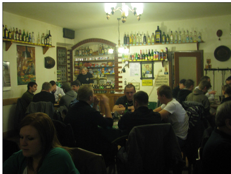
U Kozáků 2014

Hospodu jsme s manželkou znovu otevřeli 14. června 1991. Je stejně zařízena jako ta dřívější, jen krb je nový, dříve tu bývala kamna. Kulatý stůl uprostřed je původní, výklenek ve zdi za výčepem také. Stejný pult i výklenek se nachází o patro výš v sále, kde bývaly sokolské zábavy a divadla. Poslední divadlo tu bylo odehráno někdy na začátku 60. let hostujícím souborem, trpínské soubory už v té době nehrály. V místnosti za výčepem, kde stál před lety kulečník, bývala kuchyň. Tam, kde jsou dnes záchody, mívál dědeček trafiku.