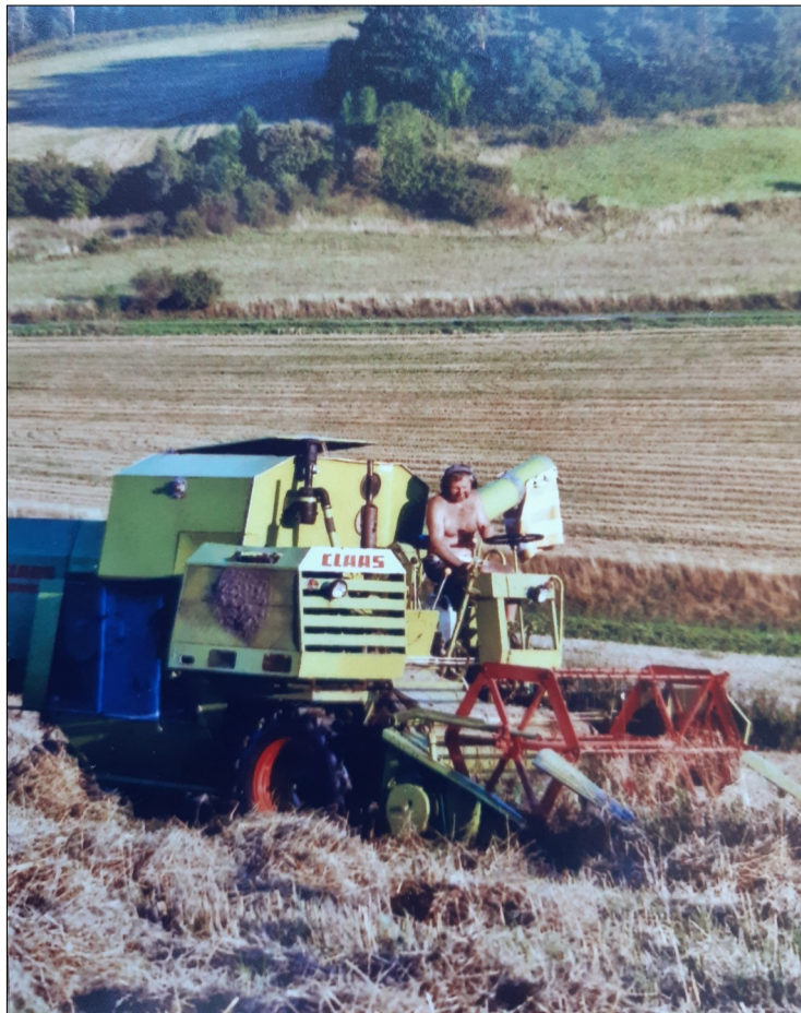
Pan Kozák na poli

V roce 2015 jsem zemědělskou činnost ukončil, stroje prodal a pole pronajímám.