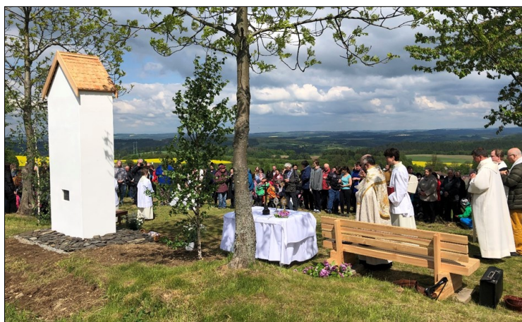
Svěcení Boží poklony pod Panským vrchem

Již v zimním období jsme začali zpřístupňovat zarostlé polní cesty, které můžete využít při vašich vycházkách a výletech do přírody. Obzvláště bych chtěl doporučit cestu pod Panským vrchem, ze které je nádherný výhled na naši obec a do širokého okolí. Nad touto cestou a nad celou naší obcí nově ční krásná stavba Boží poklony, která se zařadila mezi dominanty naší obce. Chtěl bych velice poděkovat všem, kteří se na této stavbě jakýmkoliv způsobem podíleli.