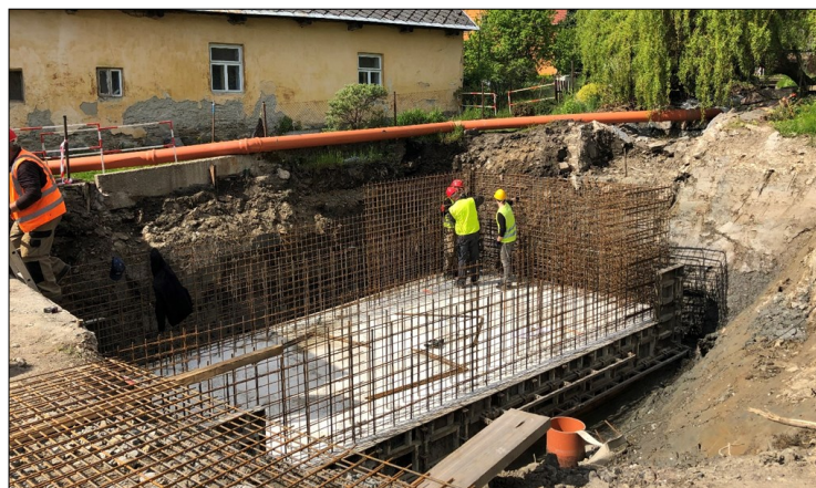
Oprava potoka v Hlásnici

V Hlásnici postupují práce na opravě koryta potoka. Oproti původnímu harmonogramu začaly na dolní části obce a horní část je v plánu v období červenec/srpen. Investor akce Lesy ČR se svojí