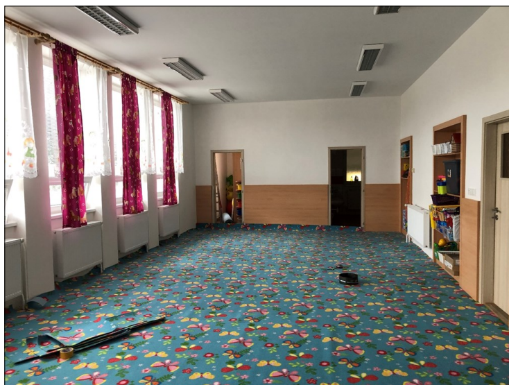
Opravená třída ve školce

Ve školce došlo ke kompletní rekonstrukci hlavní třídy. Stav interiéru byl původní z roku 1974, proto došlo k výměně radiátorů, elektroinstalace, omítek a ostatních prvků. Třída opravdu prokoukla, a tak jsme mohli přivítat naše děti po prázdninách v novém prostředí. Na akci bude využita schválená dotace z Programu rozvoje venkova (SZIF) ve výši 80 % výdajů.