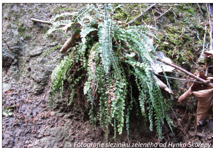
Fotografie sleziníku zeleného

Lokalita má podhorský charakter. Botanici zde zaznamenali výskyt druhů vyšších poloh, třeba keře zimolezu černého (mnohem vzácnějšího než běžný zimolez pyřitý), růže převislé a zejména sleziníku zeleného, který zde má izolovaný výskyt. Je to nenápadná malá kapradina s rozsáhlým areálem rozšíření (horské oblasti Evropy, severní Asie, pohoří Atlas na severu Afriky, Severní Amerika). U nás je však vzácný a vyhledává vlhké, stinné skály, především vápencové. Častější je jen v Krkonoších, Moravském krasu a v Hrubém Jeseníku. Často se s ním setkávám ve vápencových částech slovenských Karpat, třeba ve Slovenském ráji. Na Kavínách roste v jedné ze soutěsek v blízkosti Bílého pramene. Výše na skalnatých stráních lze vidět mnohem hojnější sleziník červený. Poznají se od sebe dobře – řapíky listů sleziníku zeleného jsou sytě zelené, v případě sleziníku červeného hnědé až červenohnědé.