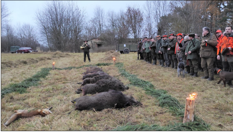
výřad ulovené zvěře po letošní naháňce

Konec kalendářního roku bývá u myslivců vždy vyvrcholením jejich celoroční práce. Byť úředně končí myslivecký rok až v březnu, právě listopad a prosinec jsou časem společných lovů, kdy odedávna docházelo k pomyslné „sklizení“, odměně za starost o honitbu a zvěř během předcházejících měsíců.