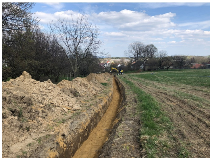
Výměna vodovodu v Trpíně

Pro projekční práce na kanalizaci a ČOV byl vybrán dodavatel. Vítězem výběrového řízení se stala firma RECPROJEKT s.r.o., která má za sebou mimo jiné úspěšné realizace pro Oldřiš, Boro-