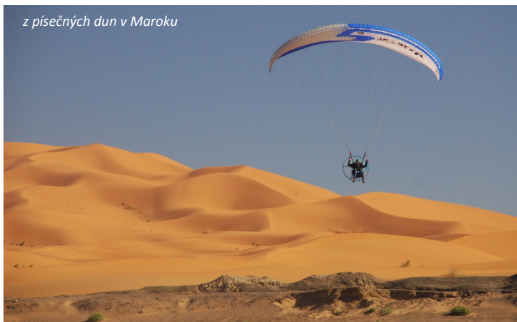
z písčiny dun v Maroku

Největší úraz jsem utrpěl při mistrovství republiky v motorovém paraglidingu u Plzně v roce 2002. Moc foukalo a k večeru vítr ještě stoupal. Přesto jsme chtěli letět. Při návratu k letišti mě vítr sfoukl, padák se mi dostal na hlavu a ze 100 metrů jsem byl na zemi za 4 vteřiny. Mimo jiné jsem měl prasklou pánev, k čemuž mi doktor řekl, že aspoň vím, jak se cítí žena po porodu. V tomto závodě jsem měl z předchozích závodů tak veliký náskok, že jsem to mistrovství nakonec stejně vyhrál. Medaili mi přinesli do nemocnice. Dvacet dva dnů po pádu jsem znovu letěl.