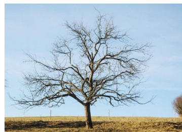
Jabloně před a po správném řezu