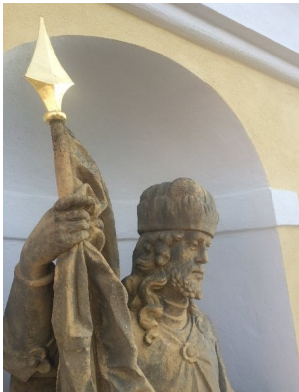
zrestaurovaná socha sv. Václava v průčelí kostela sv. Václava v Trpíně

Energetická krize se promítne i do přípravy obecního rozpočtu pro příští rok. Zvýšené náklady zredukovat možnosti investic. Veřejné osvětlení je již v úsporném LED provedení a momentálně řešíme možnosti umístění fotovoltaické elektrárny na střechu kulturního domu. Stav střešní krytiny je ale na hranici životnosti, a tak si tato realizace vyžádá komplexnější investici.