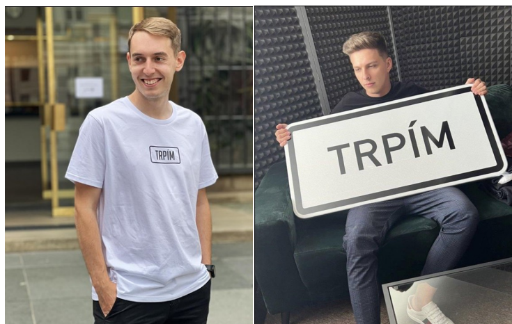
Youtubeři nechali vyrobit ceduli a trička s nápísem Trpím

podle nich trpí, a přikládali k tomu fotku s cedulí naší vesnice. Sbírali několik tisíc ohlasů denně a Trpín tak pobavil celý český internet.