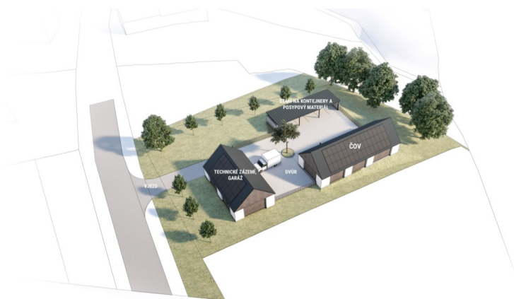
Koncept řešení technického zázemí obce, sběrného dvora a ČOV, autor Ing. arch. Ondřej Novotný a Ing. Vít Sladký

zásadní položkou příspěvek na plán financování budoucí obnovy kanalizace, který se počítá z celkové hodnoty díla. Dle zákona je nutné jej po dobu životnosti vytvářet a vybírat právě ve stočném. Stejně jako tisíce rodin, které za poslední rok musely změnit plány na vlastní dům za nájemní byt z důvodu, že si to jednoduše nedokážou moci dovolit, budeme muset v příštím roce po vysoutěžení skutečné ceny pečlivě zvážit naše možnosti a rozhodnutí do tohoto projektu naplno vstoupit.