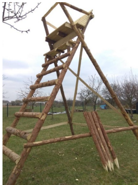
Hotový nůžkový posed s připravenými kůly pro ukotvení do země (Břenek, 2019)

Stavba posedů je časově náročná a je důležité se na samotnou stavbu dobře přichystat. Většina myslivců si tato myslivecká zařízení staví sama na vlastní náklady. Prvním krokem je zvolit umístění posedu. Tato volba navazuje na zvolení typu posedu či jednoduchého žebříku, který bude vhodný do určitého terénu. Dalším krokem je obstarání materiálu a přichystání potřebného nářadí a pomůcek k vlastní stavbě.