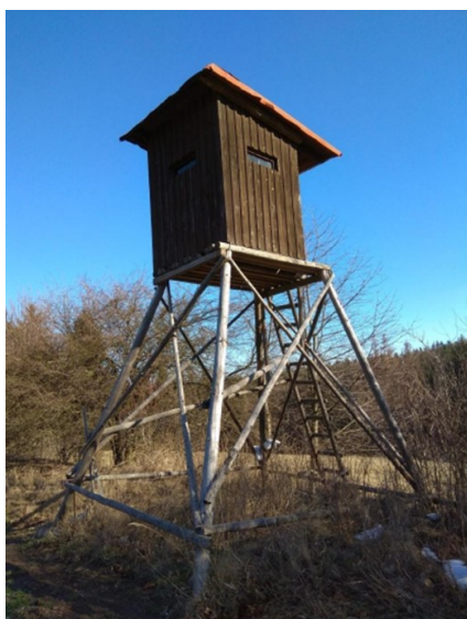
Kazatelna Čechovo pole (Břenek, 2019)

Určitě pro vás není nic neobvyklého, že při procházkách přírodou narazíte na nejrůznější myslivecká zařízení. Myslivecká zařízení jsou velmi důležitou pomůckou pro výkon práva myslivosti v našich lesích. Kromě krmelců, sloužících myslivcům a zvěři zejména v zimním období k přikrmování zvěře obilím či senem, jsou louky nebo okraje lesů plné různých typů posedů.