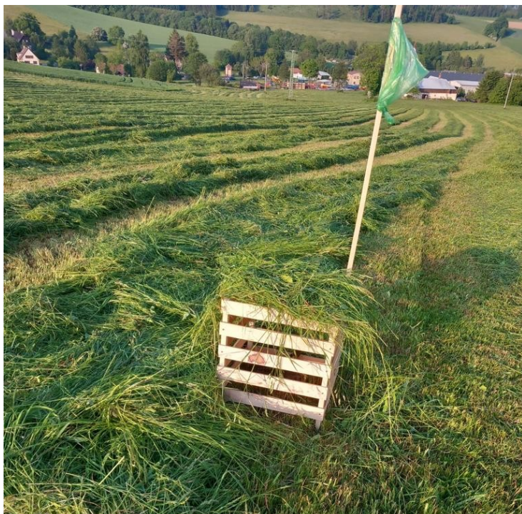
Po nalezení mláďete se k němu myslivci vydají, seberou ho do bedýnky a vynesou mimo sekanou louku. Nebo srnče bedýnkou zakryjí a místo označí, aby se mu sekací stroj vyhnul

Co se týče zajištění krytu, je to velice různorodé. Zemědělci se mohou zaměřit třeba na obhospodařování menších polí nebo vytvářet různé biopásy. V našem spolku jsme v posledních letech vysazovali stromy na meze, které už byly téměř „holé“.