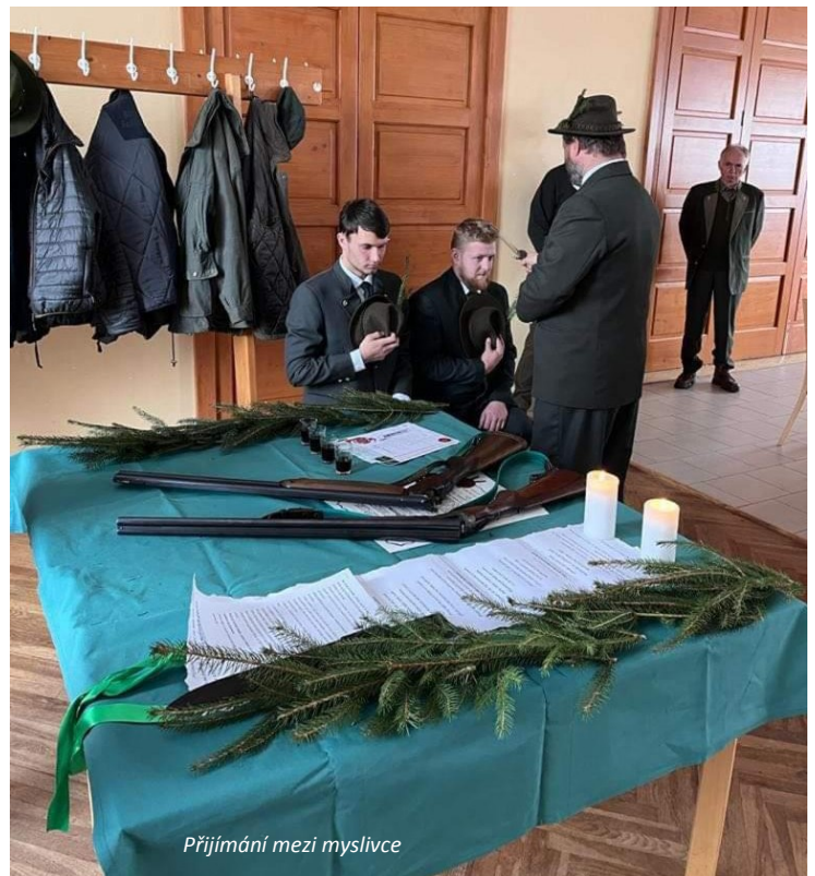
Přijímání mezi myslivce

Nejdříve je potřeba si uvědomit, že stát se myslivcem a členem spolku jsou dvě zcela rozdílné věci. Pokud se někdo chce stát se myslivcem, musí složit tzv. zkoušku o první lovecký lístek, které předchází praxe v honitbě pod vedením zkušeného myslivce. Předměty, z nichž se skládá povinná zkouška, jsou: historie myslivosti a lovu, myslivecké zvyky a tradice, legislativa upravující myslivost, myslivecká zoologie a biologie zvěře, chov zvěře, ekologie a etologie, kynologie, základní nemoci zvěře a lovectví. Dále může následovat vykonání zkoušky pro získání zbrojního průkazu. Člověk ale může být myslivcem, aniž by byl členem nějakého spolku. O členství si spolky většinou rozhodují samy – vytvoří kritéria, na základě kterých mezi sebe přijímají nové myslivce.