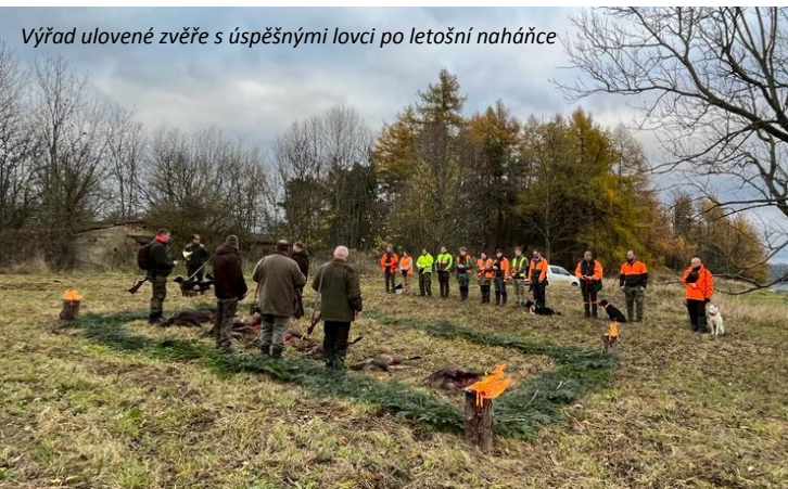
Výřad ulovené zvěře s úspěšnými lovci po letošní naháňce

S tímto názorem se setkal už asi každý z nás, bohužel. Většinou jsou lidé přesvědčeni o své pravdě, aniž by pochopili podstatu a význam myslivosti. Myslivost je především o péči o zvěř. A jedním z nástrojů je i její lov. Nejedná se však o bezmyšlenkovité střílení všeho, co v lese nebo na poli potkáme. Samotnému stisknutí spouště předchází důkladné zhodnocení daného kusu s ohledem na to, zda je vhodný do chovu, či nikoliv. Například u srnčí zvěře nás zajímá, jestli je zdravá, zda je vyvinuta tak, jak má být, a jak je stará.