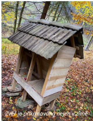
Zvěř je přikrmována nejen v zimě

Za normálních podmínek se o sebe zvěř umí postarat sama bez naší pomoci. Ale námi všemi pozměněná krajina jí už bohužel ani zdaleka nenabízí vše potřebné, a tak je péče o zvěř jednou z hlavních mysliveckých činností. Aby prosperovala, byla zdravá a vitální, nezpůsobovala škody v lese a na poli, musíme jí zajistit především: klid, kryt a potravu.