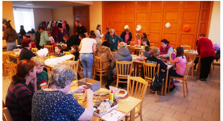
B B D L M M A

čené různé vánoční sladkosti, uvařený punč i čaj. Děkujeme za účast rodičům i dětem a těšíme se na jaro a na velikonoční dílničky.