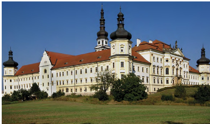
Barokní areál Klášterní Hradisko u Olomouce