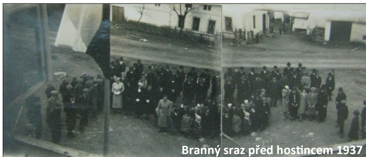
Branný sraz před hostincem 1937

Koncem roku má jednota 32 členy. Cvičili 3 muži, 24 dorostenci, 23 žáci; 2 sestry, 8 dorostenek a 15 žaček. Uspořádáno bylo 10 proslovů, 1 besídka, 4 div. představení, 3 loutková divadla.