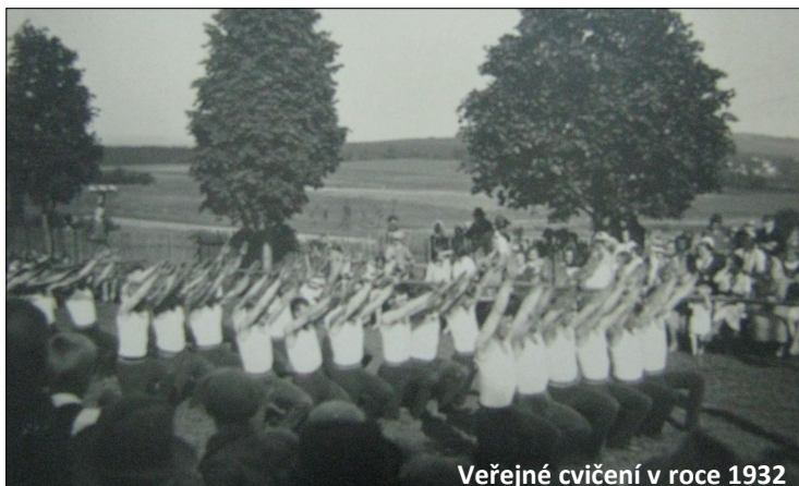
Veřejné cvičení v roce 1932