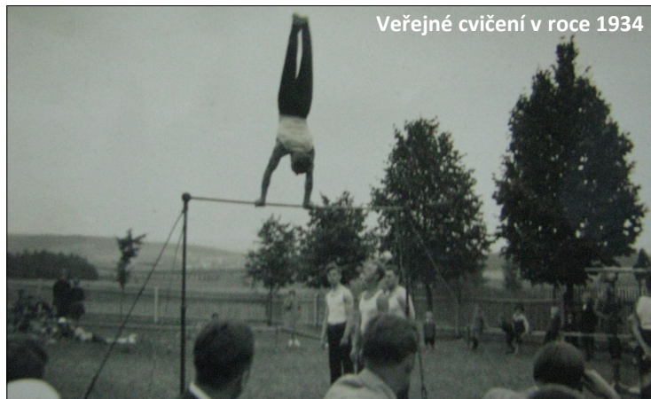
Veřejné cvičení v roce 1934

Svátek Svobody [28. října] oslavila jednota tím, že účastnila se v předvečer svátku společně s ostatními spolky a občany průvodu obcí, který vyšel z horního konce, doprovázen místní hudbou prošel obcí, načež se všichni účastníci shromáždili v [dnes již neexistující-