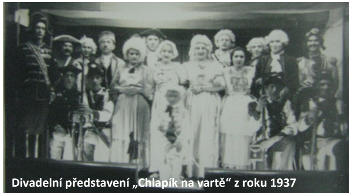
Divadelní představení „Chlapík na vartě“ z roku 1937